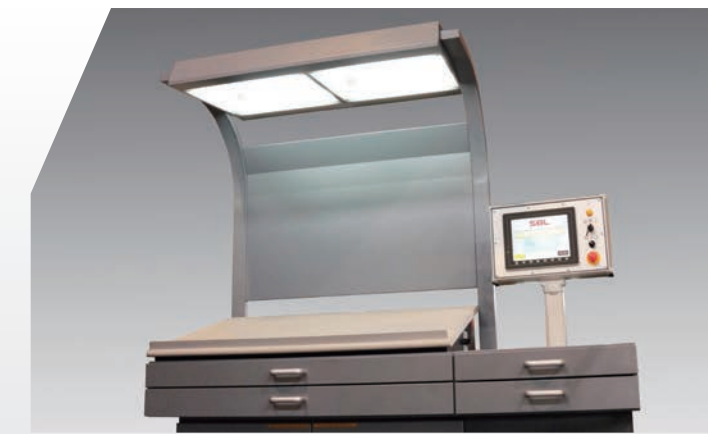
Advanced Servo Electrical Control System 箔コントロールパネル&箔制御盤