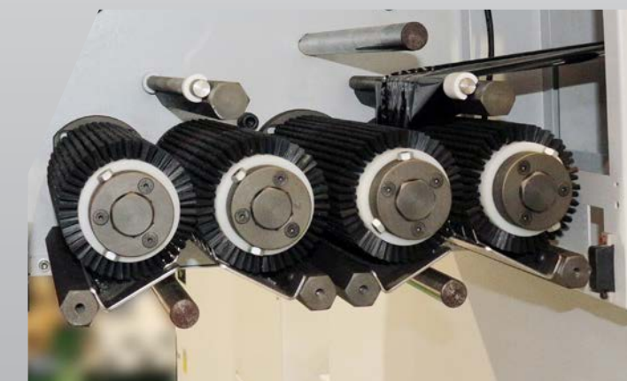
Servo Brush Rewinding Device サーボ式巻取り送りブラシロール