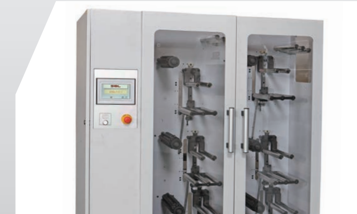
6 shafts rewinding Device 縦用箔巻取り装置6軸