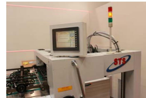
メインタッチパネル