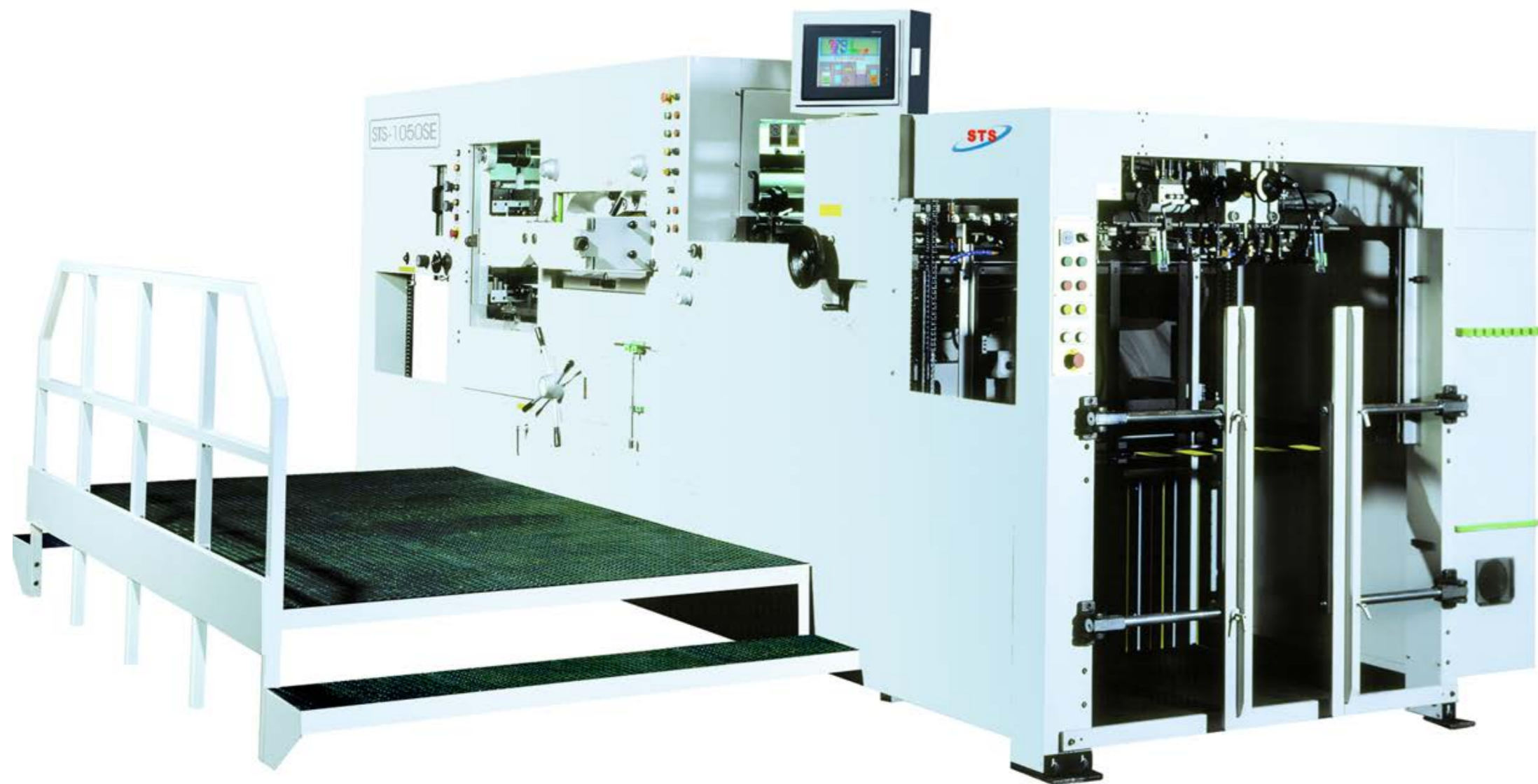
写真のモデルは機械本体300mm嵩上げ無し