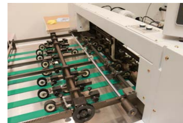
給紙コロクイックセット