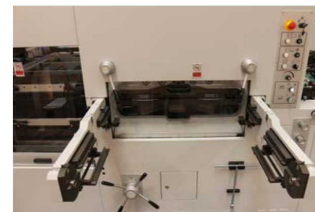
打抜ステーション