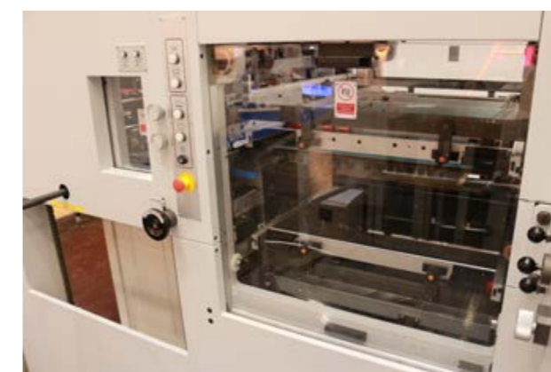
カストリセクション